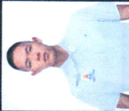
นักเรียน