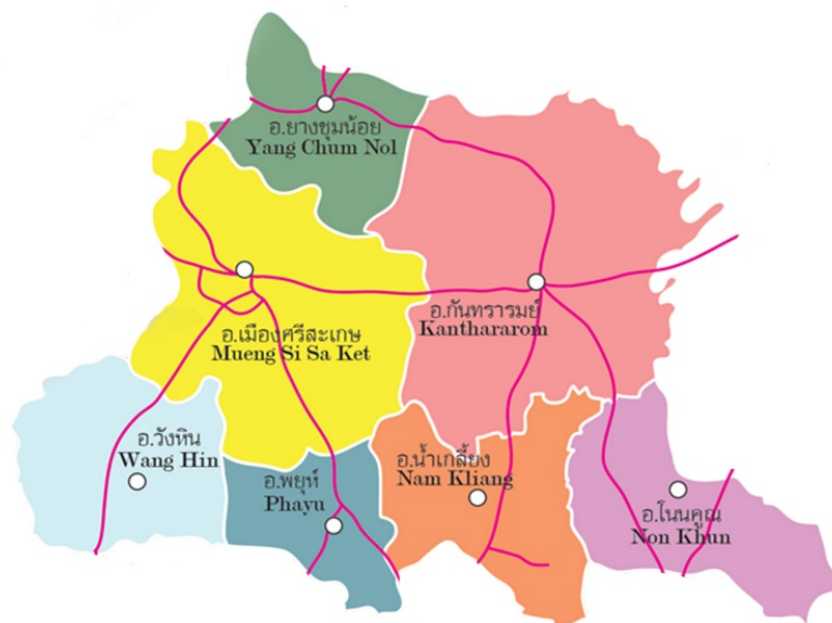
รูปภาพที่ ๑ แสดงเขตพื้นที่บริการ