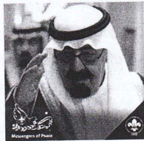
King Abdullah of Saudi Arabia

สมเด็จพระราชาธิบดี แห่งซาอุดีอาระเบีย ได้ทรงสังเกตการณ์โครงการดังกล่าวอย่างใกล้ชิด และทรงกล่าวไว้ว่า “ลูกเสือเป็นผู้นำสันติภาพ” “Scouts are the messengers of peace” สมเด็จพระราชาธิบดี อับดุลลอห์ บิน อับดุลอะซีซ อาล สะอูด และ สมเด็จพระราชาธิบดี คาร์ล ที่ 16 กุस्ताฟ แห่งสวีเดน ประธานกิตติมศักดิ์มูลนิธิลูกเสือโลก ได้รับความประทับใจอย่างมากจากการปฏิบัติงานของลูกเสือ จึงได้พิจารณาว่า จะต้องเผยแพร่กระจายความสงบสุขให้มากยิ่งขึ้น