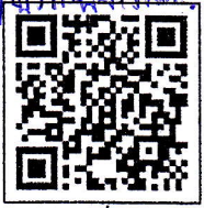
สแกนเพื่อสมัคร

เรื่อง ผอ. สพป. กค. ๑. - ดิเรก จ.ศค. ขอประชาสัมพันธ์หน่วยงาน หรือผู้ที่สนใจ เข้าร่วมกิจกรรม CHULA105 วิ่งทูลุหรรษ์ บันดาลใจ. โดยสแกนผ่าน QR Code ที่แนบมาพร้อมนี้ - เห็นควร ประสานสื่อมวลชน ให้มีข่าว. - จึงเรียนมาเพื่อโปรดทราบ