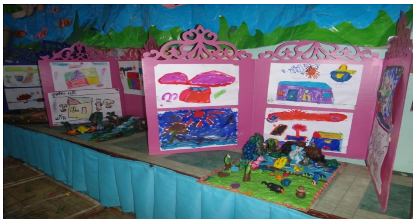
มุมผลงานการปั้นและการวาดภาพบุญบังไฟ