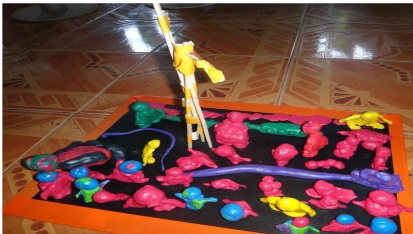
งานบุญบังไฟที่วัด