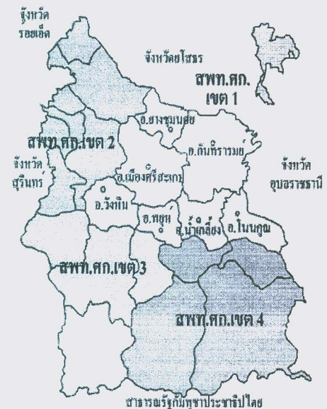
แผนที่แสดงเขตพื้นที่การศึกษาศรีสะเกษ